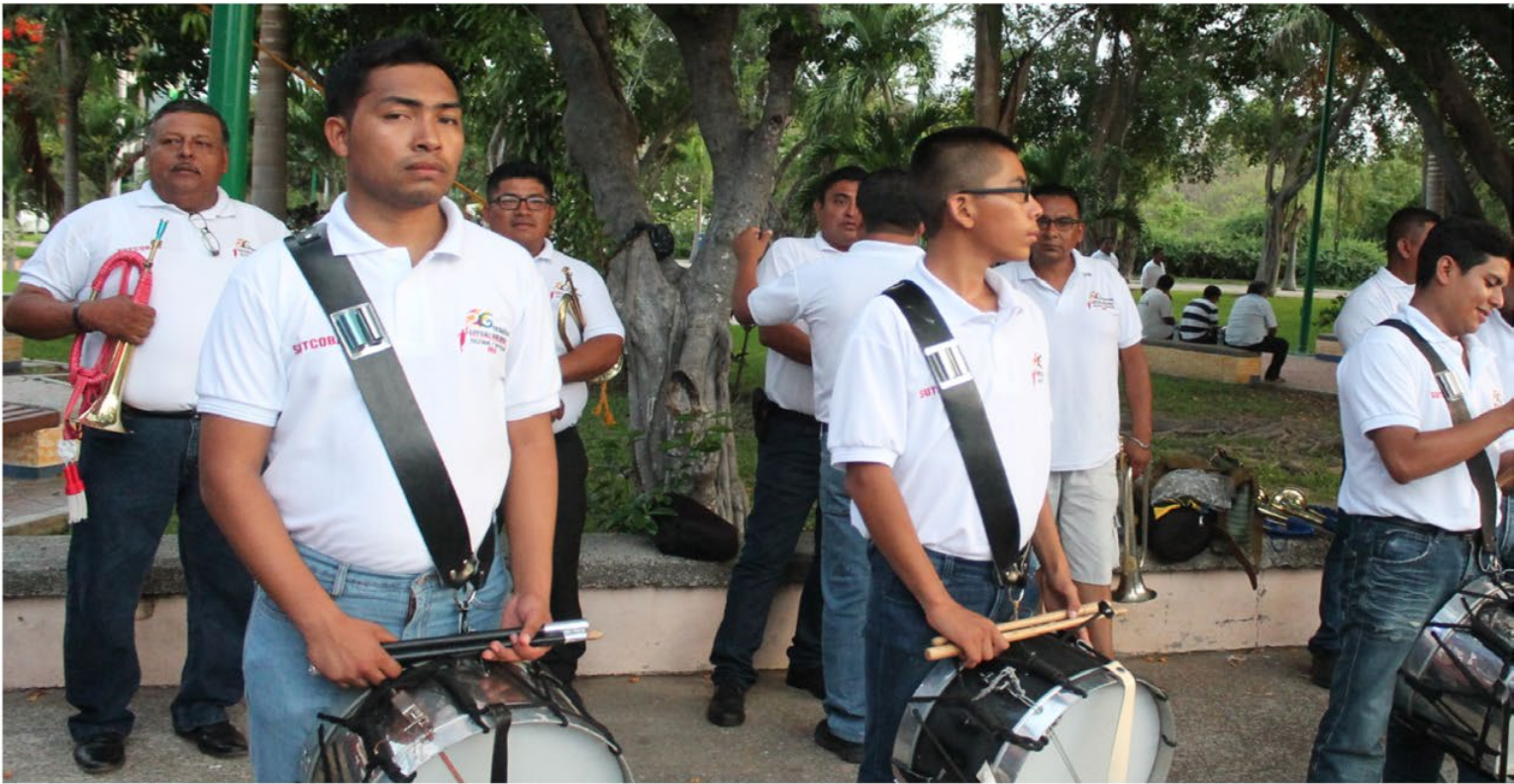
B) ESCOLTA DEL SUTCOBAO