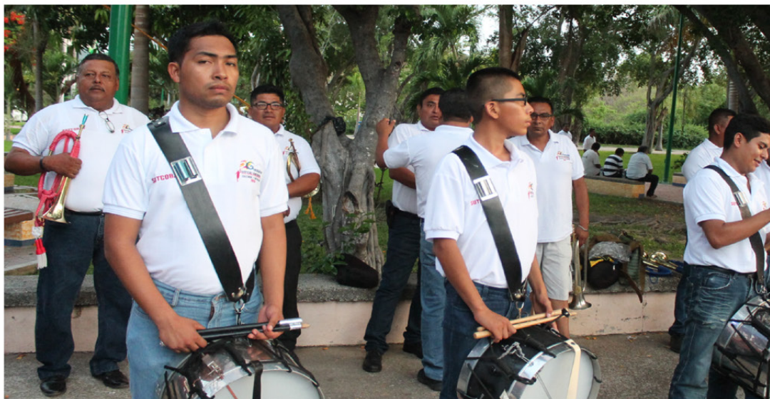
B) ESCOLTA DEL SUTCOBAO